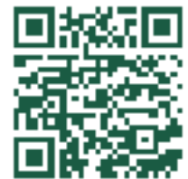
Calculadora AIMCRA energía